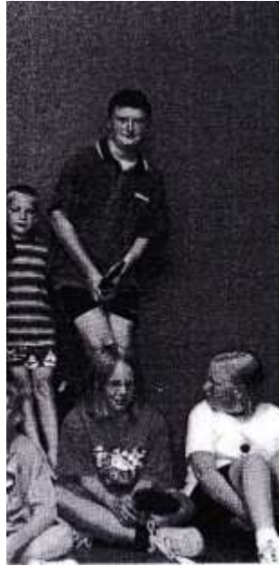
Die TT-Jugend 2000

Einen sportlichen Leckerbissen, wie ihn die Oldenburger Tischtennisgemeinde noch nie erlebt hatte, boten die Turaner anlässlich des 111jährigen Vereinsgeburtstages am 20. Juni 1987 im Schulzentrum Kreyenbrück an der Brandenburger Straße. Der amtierende Weltmeister China mit dem seinerzeit weltbesten Spieler Chen Xinhua an der Spitze spielte gegen eine Auswahl mit den europäischen Spitzenkönnern Dragutin Surbek und Zoran Primorac aus Jugoslawien und dem niedersächsischen Juniorenmeister Holger Koenigs aus Borssum (als „Lokalkolorit“). Das Fazit von Abteilungsleiter Klaus-Peter Wanschura: „Vom sportlichen Geschehen allererstes Niveau, enttäuschend dagegen die Zuschauerresonanz.“ Ganze 126 Eintrittskarten konnten die Turaner verkaufen.