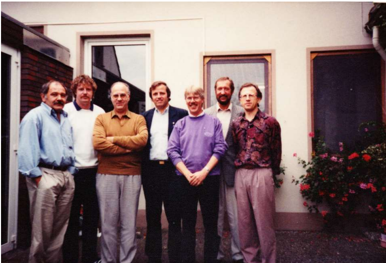
Sechs Spieler der »ersten Stunde«.